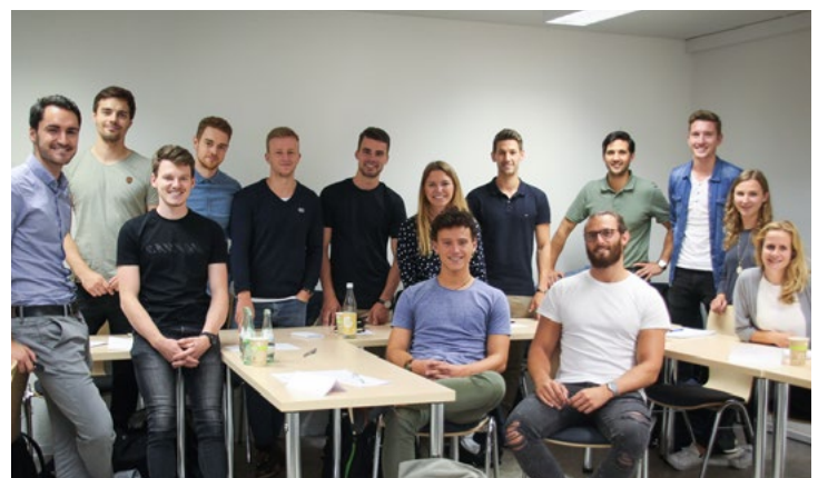
Teilnehmerinnen und Teilnehmer des Workshops „Einstiegsgehalt verhandeln“

Aufgrund der positiven Resonanz wird das Workshop-Programm um das Thema „Potenzialanalyse nach GPOP“ erweitert. „Wir hoffen, dass wir damit ein weiteres Angebot schaffen, das Studierenden aber auch Absolventinnen und Absolventen die Orientierung und Weiterentwicklung im Beruf ermöglicht“, so Vorstandsvorsitzender Stefan Walzel zum neuen Angebot.