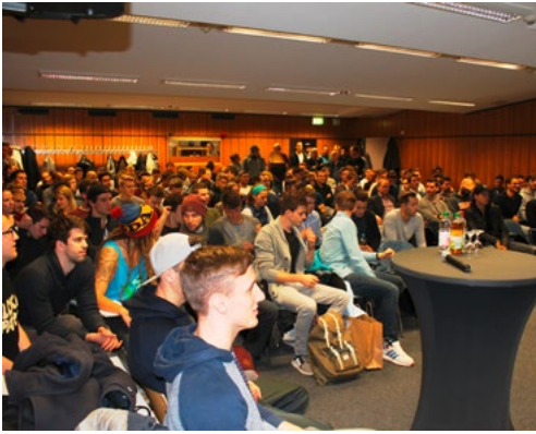
Volles Haus im Hockeyjudozentrum