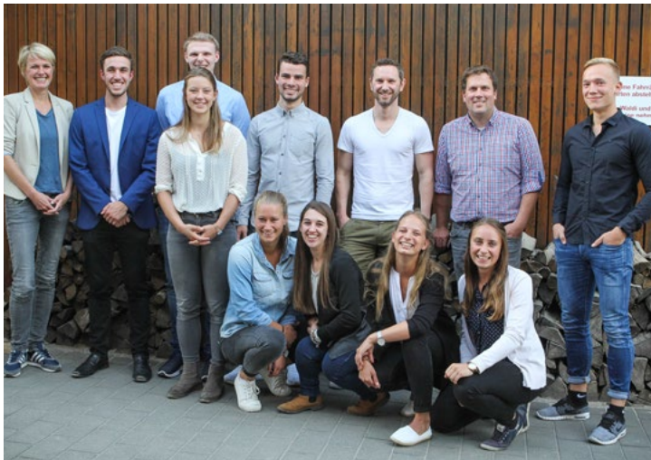
Auftakt des Mentoring-Programms an der Playa