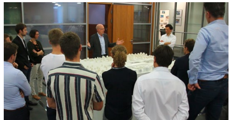
Premiere von ASS Local Insights beim DFB